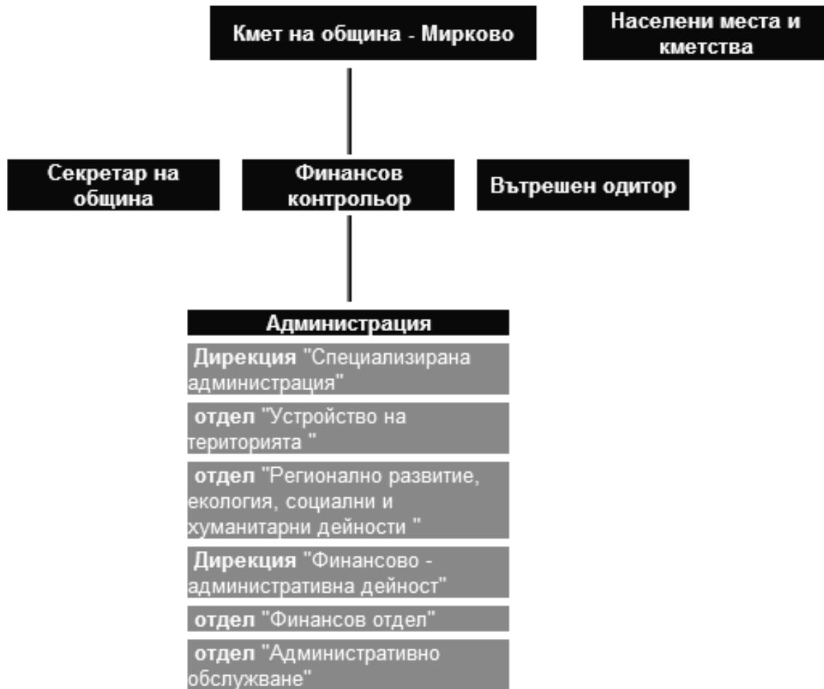
Фигура 2: Структура на общинската администрация 28